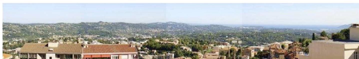
(Vue de la terrasse)